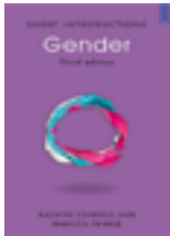
Gender in world perspective (2014) Connell, R.

Desde epistemologías feministas, pasando por el concepto de interseccionalidad, hasta teorías contemporáneas sobre feminismo, estas lecturas sugeridas permiten tener un panorama amplio del alcance del pensamiento feminista y los problemas asociados al sexismo