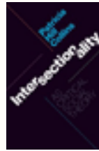
Intersectionality As Critical Social Theory. (2019) Collins, H.

Texto completo disponible en formato electrónico