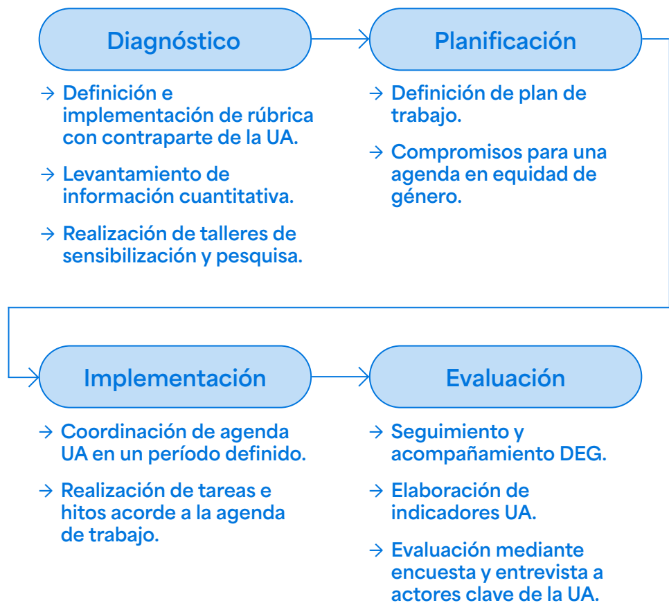
DIAGRAMA DEL PROCESO DE TRABAJO PARA INCORPORAR ENFOQUE DE EQUIDAD DE GÉNERO EN LA UNIDAD ACADÉMICA

En el siguiente esquema se observa el proceso de trabajo que se considera en cada caso.